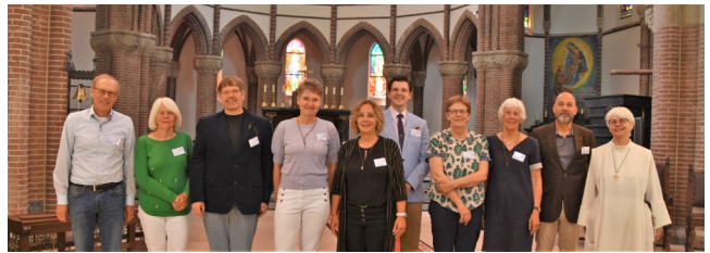
Kernteam Wegen met Zegen