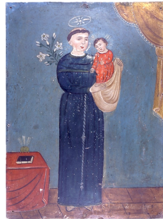
Saint Anthony of Padua, Anonymous Mexico, 1901. NMSU Art Gallery Collection

Ik hoop daarom dat ik, samen met Paul Keijsers, organist, weer muzikaal een bijdrage kan leveren aan een kerkdienst of anders. Dank ook aan het bestuur dat mij in de gelegenheid heeft gesteld in de Antonius van Paduakerk te mogen zoeken naar mijn persoonlijke grondtoon, waarmee ik hoop een bijdrage te leveren aan de kerkgemeenschap.