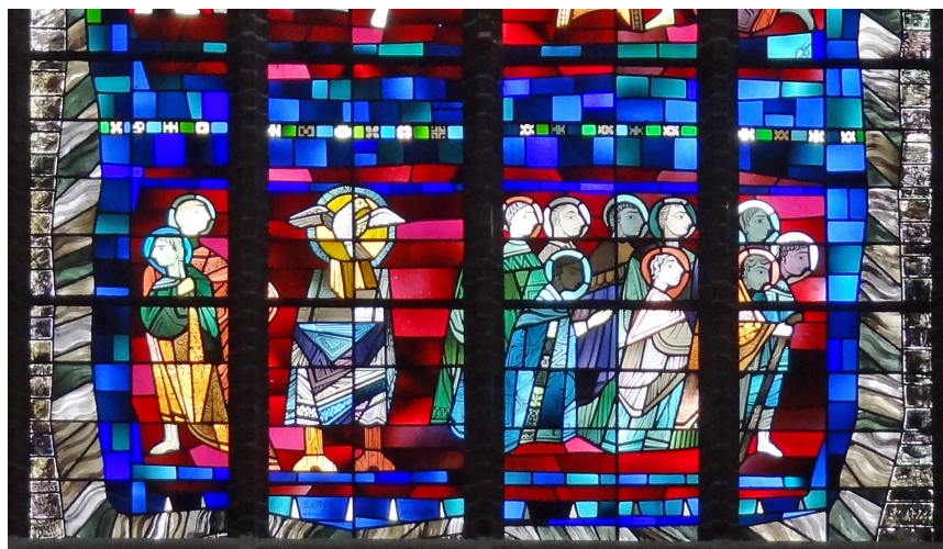
Pinksterfeest, in transeptraam, Antonius van Paduakerk