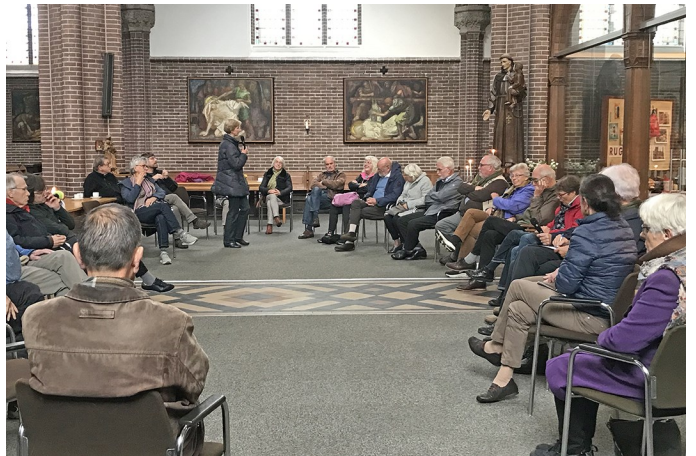
Parochieberaad 17 oktober jl.

In het locatieberaad van 17 oktober j.l. hebben we met elkaar over verschillende zaken gesproken. Dat betreft de vervanging van het marmeren altaar door een verplaatsbaar altaar, zodat onze kerk meer mogelijkheden biedt voor concerten en bijeenkomsten. Het inrichten van een pelgrimskapel die dagelijks geopend zal zijn; niet alleen voor pelgrims maar voor iedereen die een kaarsje wil opsteken of een moment van stilte zoekt. Ten slotte, het werken aan een toekomstvisie. Het is belangrijk om te vermelden dat we die visie niet alleen kunnen opstellen. We zullen het uiteraard goed voorbereiden, maar hebben het gesprek nodig met u en met ieder die zich betrokken voelt bij onze kerk en onze gemeenschap. Daarom zullen we een of meerdere bijeenkomsten organiseren met een externe gespreksleider. U hoort er dus nog van. Uiteraard zullen we hierover open communiceren met de Stefanusparochie.