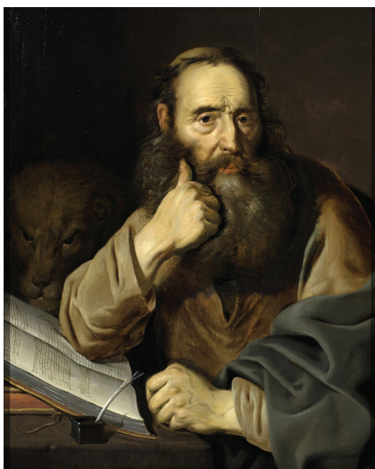
Marcus geschilderd door Rembrandt