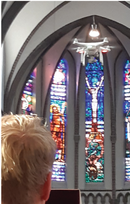
Filmen van bovenaf