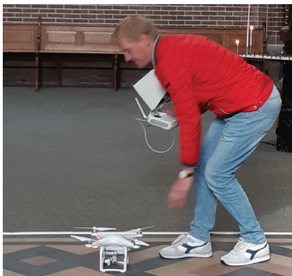
Vliegklaar maken drone