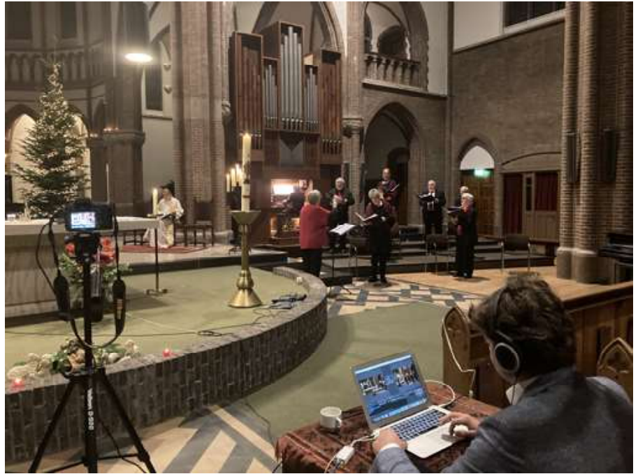
De opname van de Nachtmis