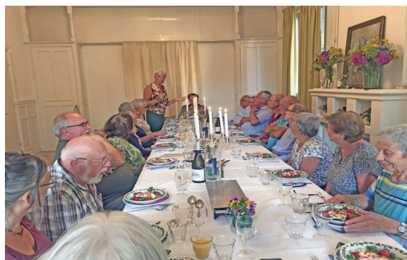
Koorentje in de pastorie 4 Juli 2022