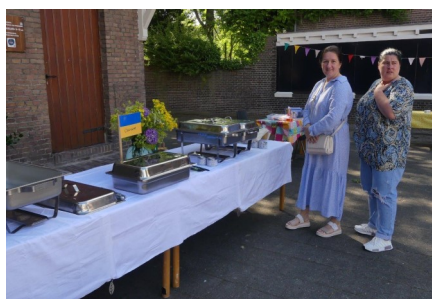
Er zijn 3 buffetten uit verschillende landen. Op de foto: Oekraïne.