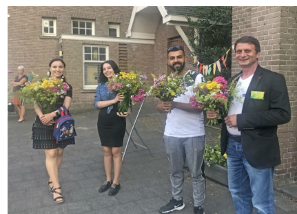
Afsluiting: kooksters en muzikanten worden bedankt met bloemen