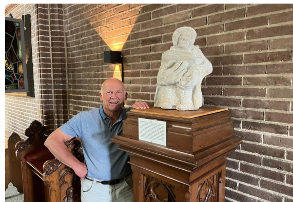
De Kunstenaar bij zijn creatie: Sint Werenfridus