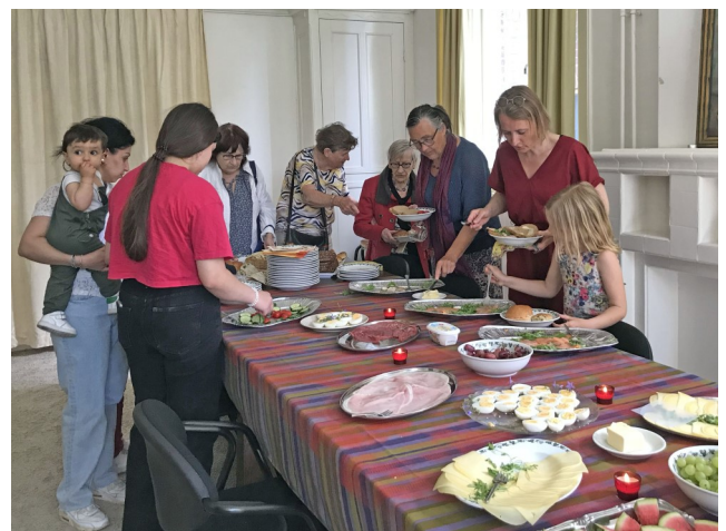
Samen lunchen op de vrijwilligersdag 12 juni 2022.