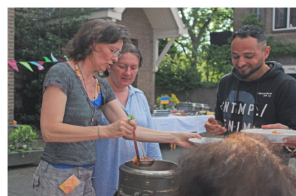
We beginnen met heerlijke soep, hier van het Oekraïense Buffet.