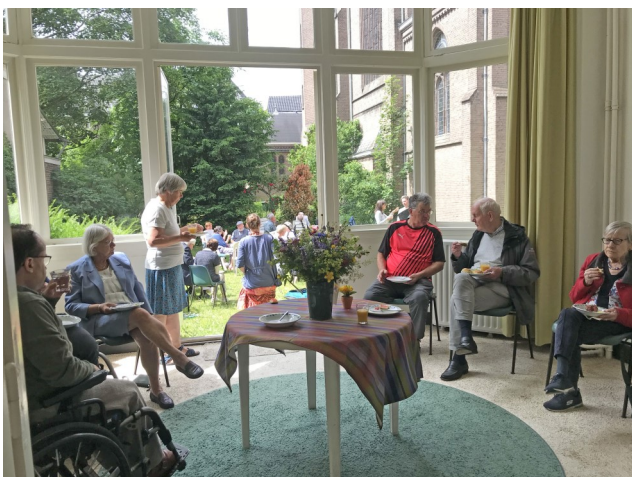
Bijpraten op de vrijwilligersdag 12 juni 2022.