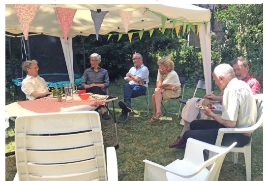
De pastorietuin was ondanks de warmte toch een fijne plek.