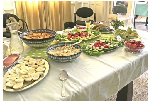
Rijk gevuld lunchbuffet met overheerlijke salades.