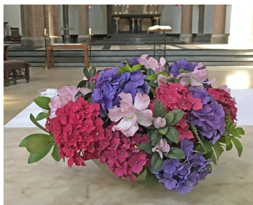
Altaarstuk juli 2023 gemaakt door Ans Asberg.