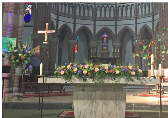
Altaarstuk bij het 100jarig bestaan van de kerk, juni 2017.

Op hoogtijdagen zoals Kerstmis en Pasen en het 100jarig bestaan van onze kerk in 2017 waren zij daarmee heel wat uren bezig.