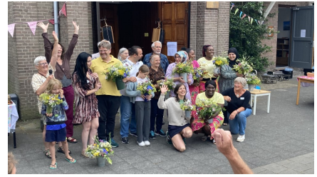
Pleindiner 27 Juni 2023