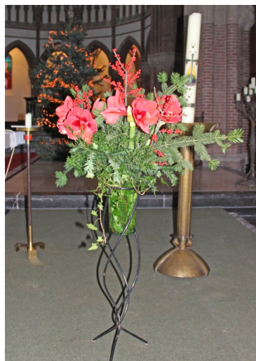
Kerststuk December 2021.

Dat zij moge ruste in vrede en herenigd moge worden met de mensen die haar voorgingen en haar lief waren.