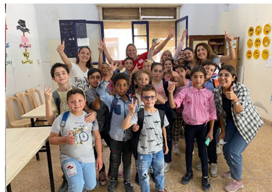
Bab Sba'a school, Frans v. der Lugt Centre