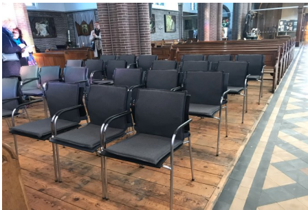
13 november 2022

Hoewel de decembermaand een maand is van duisternis en kou, voelen we dat het licht van Kerst dichterbij komt. Ook wij als Antonius zijn een licht voor onze medemens, dat blijkt uit al het werk dat verzet is de afgelopen weken. Rugzakjes zijn gevuld, erwtensoep is gemaakt en verkocht, incontinentiemateriaal is naar Oekraïne gestuurd, en op dit moment worden (voedsel) pakketten gevuld voor vele huishoudens die het moeilijk hebben.