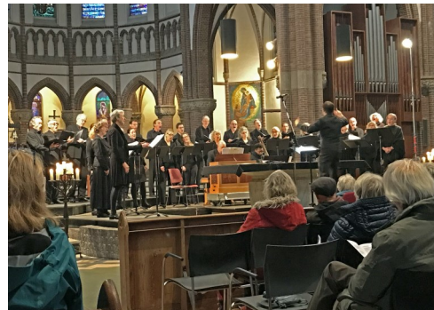
Allerzielenconcert Mnemosyne 6 November 2022

Dit wordt een serie prachtige concerten. Hartelijk welkom, noteer de data alvast in uw agenda.