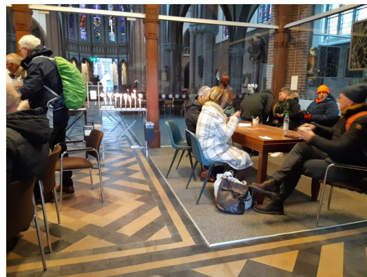
Het glazen voorportaal was een welkome plek om op te warmen bij het licht van de vele kaarsen die door lopers en bezoekers werden aangestoken